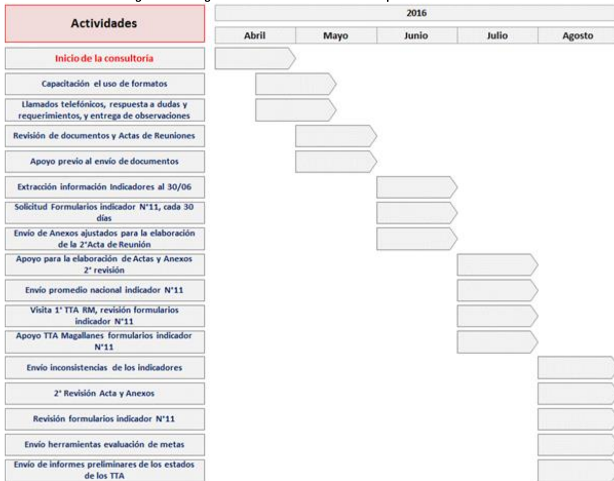
Figura 1: Cronograma de actividades Plan de Acompañamiento TTA 2016

En este apartado se detallarán las actividades relacionadas con la EJECUCIÓN DEL PLAN DE ACOMPAÑAMIENTO desarrollado a los Tribunales Tributarios y Aduaneros. Para lo cual, a continuación, se presenta una cronología de dichas actividades, en el marco del proceso de la consultoría.